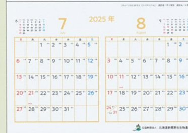
7・8月：「カムイと共に生きる (エゾオコジョ)」