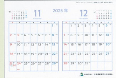
11・12月：「スノーマン (エゾフクロウ)」