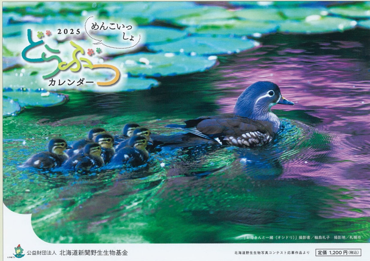
表紙：「お母さんと一緒 (オンドリ)」