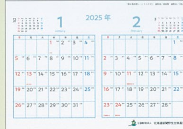
1・2月：「僕は魔法使い (シマエナガ)」