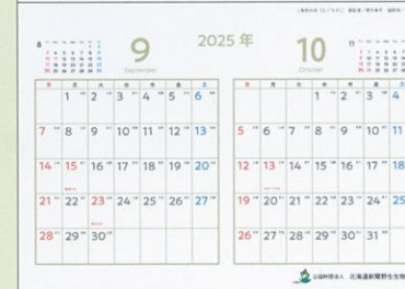
9・10月：「食欲の秋 (エゾリス)」