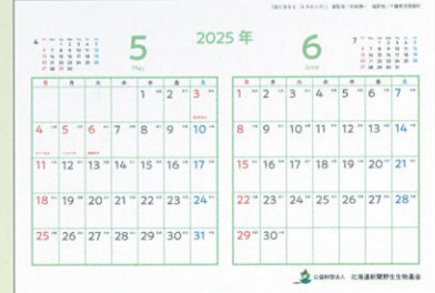
5・6月：「森に生きる (キタキツネ)」