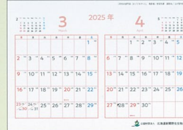
3・4月：「突然の訪問者 (エゾクロテン)」